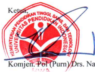
Komjen. Pol (Purn) Drs. Nanan Soekarna